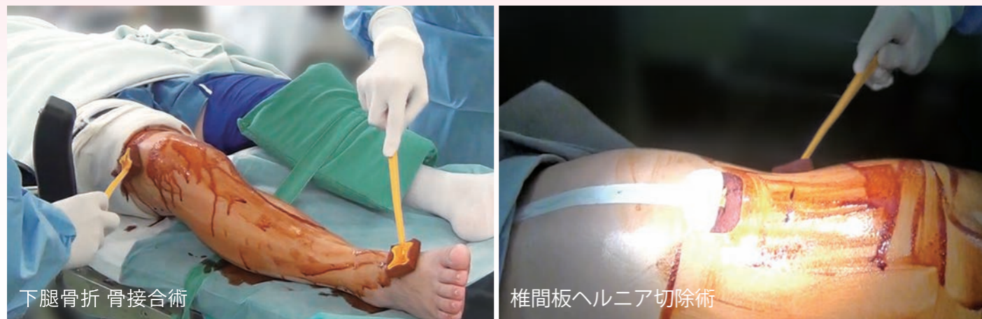
下腿骨折 骨接合術